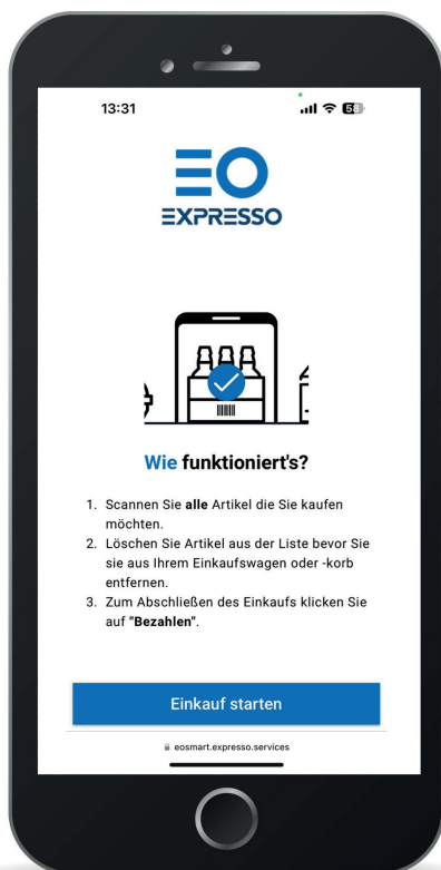
Ansicht der Smartphone-Oberfläche

Für ein Einkaufserlebnis, das begeistert!